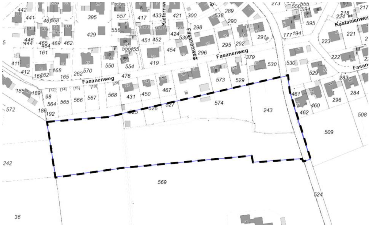
Abb. 1: Geltungsbereich des Bebauungsplans Nr. 91 „Köldingsweg-West“

Der Geltungsbereich des Bebauungsplans Nr. 91 „Köldingsweg-West“ ist in Abbildung 1 mit einer gestrichelten Linie umgrenzt. Der rd. 2,5 ha große räumliche Geltungsbereich des Bebauungsplanes liegt innerhalb der Gemarkung Österwiehe, Flur 11, Flurstücke 525, 526, 527, 574, 243 und 569 (jeweils teilweise).