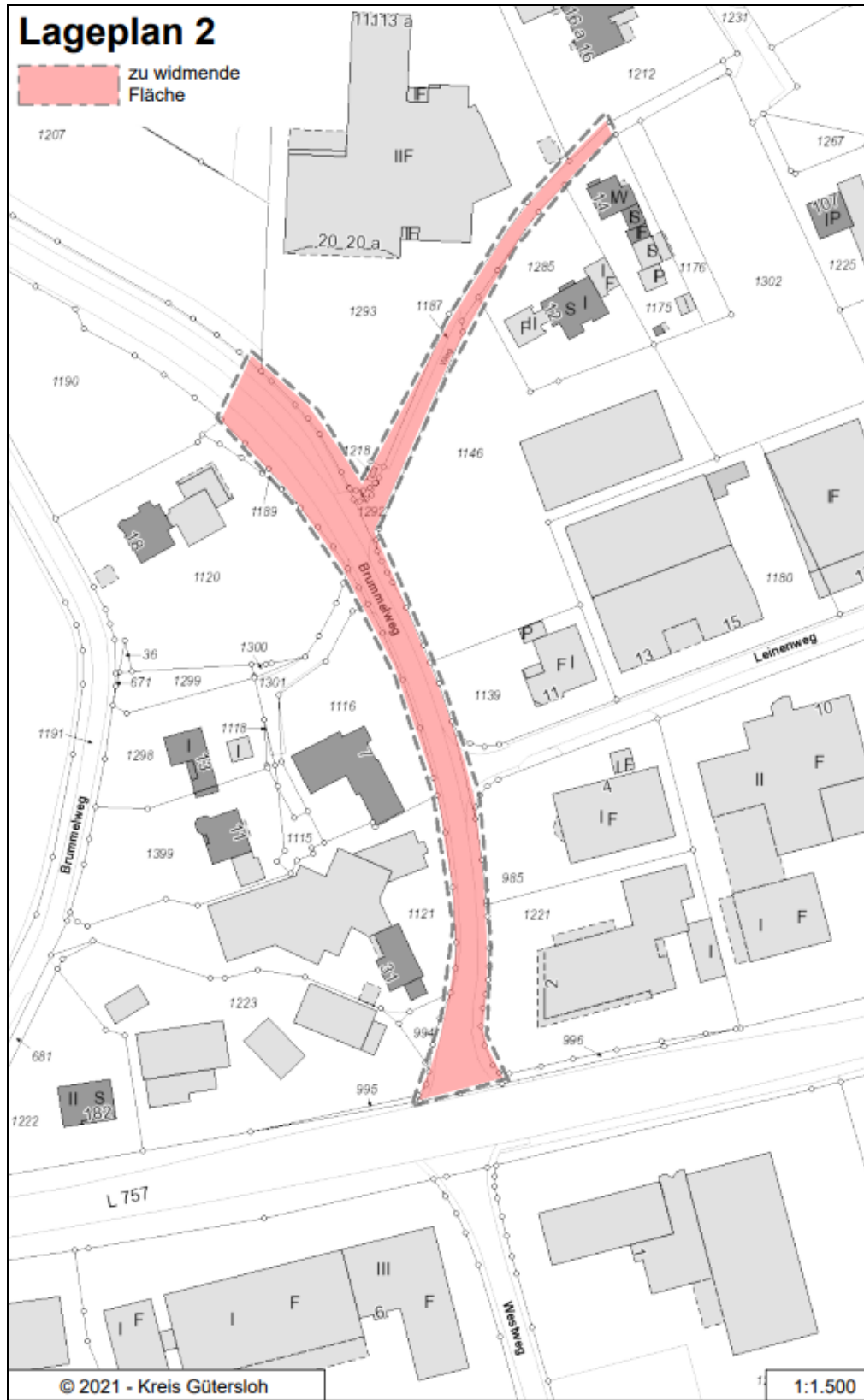
Abb. 2: Bereich der Widmung „Brummelweg“