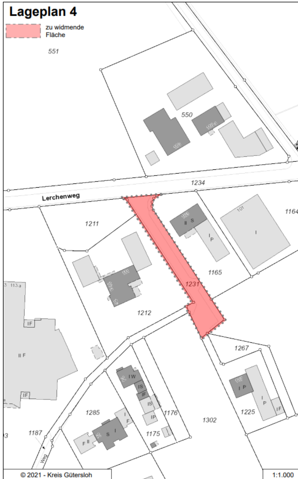
Abb. 4: Bereich der Widmung „Lerchenweg“