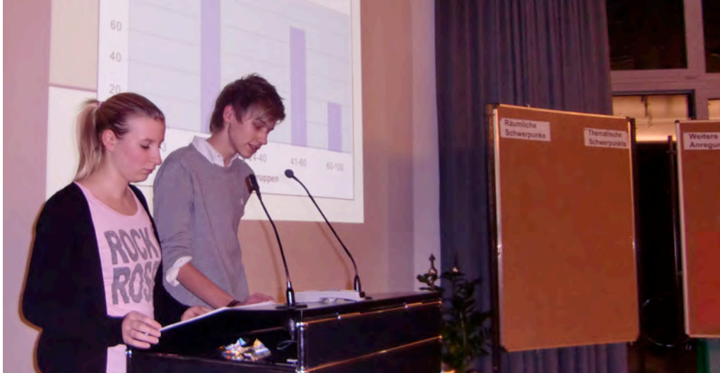
SchülerInnen des Gymnasiums beim Vortrag