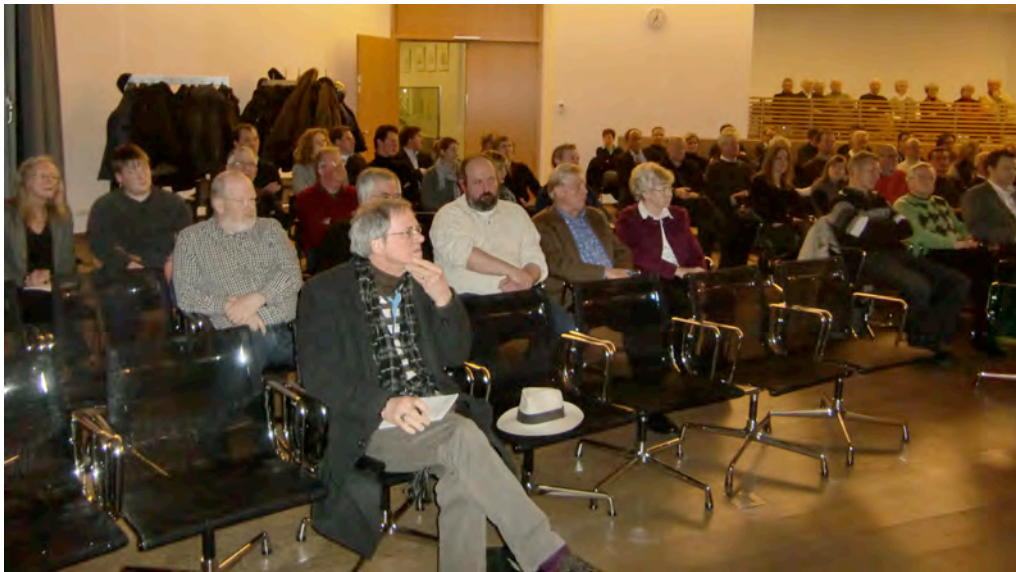
Impression von der Abschlussveranstaltung

Am 4. März 2010 fand im Großen Sitzungssaal des Rathauses der Stadt Verl die Abschlussveranstaltung zum Beteiligungsverfahren der Öffentlichkeit im Rahmen der Neugestaltung des Ortskerns statt. Fast 100 BürgerInnen nahmen hieran teil. Zu Beginn begrüßt Bürgermeister Paul Hermreck die anwesenden BürgerInnen und gibt danach an Hartmut Welters vom Büro Post • Welters aus Dortmund weiter, der kurz den Ablauf der Veranstaltung erläutert und die weitere Moderation der Veranstaltung übernimmt.