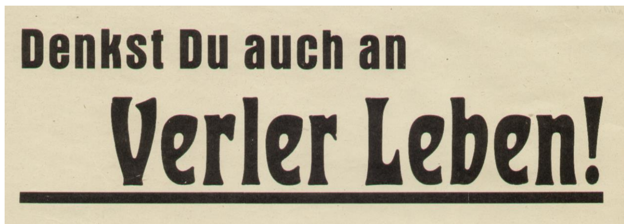
Eine Erinnerung auf einem Plakat aus dem Jahr 1949 im Stadtarchiv.

An dem regnerischen Mittwoch hatte das Volksfest auf dem Platz vor dem Bahnhof (dem heutigen Marktplatz und Busbahnhof) begonnen – mit den Geschäften der Schausteller, ihren Karussells, Schiffsschaukeln, einem Autoskooter („Autoselbstfahrer“) und Schießbuden sowie Tanz und Musik in einem Festzelt und in den Sälen und Gastwirtschaften des Dorfs. Der Haupttag jedoch war der Donnerstag mit der oben erwähnten Landmaschinenschau und dem Vieh- und Krammarkt – und besserem Wetter, was eine Zeitung als Beweis dafür sehen wollte, „daß die Verler in der Lage sind, ihr Wetter selbst zu machen“. Auf dem Viehmarkt wurden vor allem Ferkel gut verkauft, während der Auftrieb an Großvieh, also an Pferden und Rindern, weiterhin abgenommen hatte. (Bis zum Mittag waren hier schon alle Geschäfte getätigt.) Auf dem Krammarkt gab es Stände mit Textilien und Haushaltsartikeln, aber auch Obst – sehr gefragt waren Bananen – und Süßigkeiten. In diesem Bereich war ein Marktschreier, ein sogenannter Billiger Jakob, eine besondere Attraktion. Laut rufend verkaufte er Schokolade und Pralinen. „Einen gepfefferten Humor“ gab es, wie ein Redakteur beobachtete, gratis dazu.