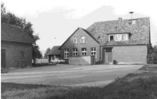
Die Tage der kleinen Landschulen waren gezählt: Die Fotografie aus dem Stadtarchiv zeigt die ehemalige Schule Österwiehe-Spitzkrug (heute Neuenkirchener Straße) ein Jahr nach ihrer Schließung, 1972.

Die Eltern in Sende konnten sich nicht einigen: Diejenigen, deren Kinder die Schule Sende-Lehmkuhl besuchten, wollten wegen der kurzen Wege an der alten Schulform festhalten; die, deren Kinder nach Sende-Brisse und Sende-Ebbinghaus gingen, konnten sich den Bau einer großen Schule in einem einzigen Schulbezirk gut vorstellen.