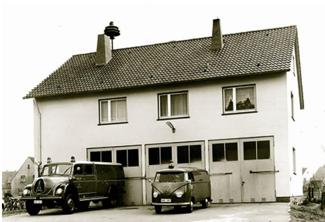
Das neue Feuerwehrgerätehaus in Verl mit den Fahrzeugen des Löschzugs im Jahr 1963.

Angesichts dieser Umstände hatte auch das Gemeindeprüfungsamt des Kreises bereits haushaltsrechtliche Bedenken geäußert: Es wurde also „unbedingt notwendig, hier klare Verhältnisse zu schaffen“, drängte Amtsdirektor Dr. Klose. Und es wurde eine Lösung gefunden: Die Amtsvertretung beschloss, dass das Amt ab dem 1. Januar des kommenden Jahres alle Feuerwehrgerätehäuser für 1 DM je Quadratmeter anmieten sollte.