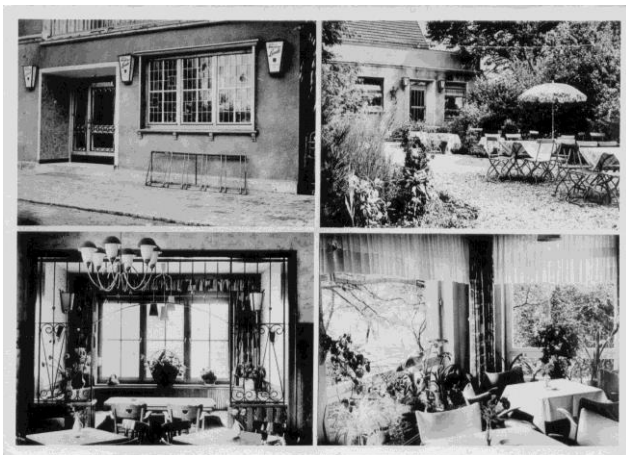
Die Ansichtskarte zeigt den Eingang, den Garten und die Innenräume der Gastwirtschaft „Friedenslinde“ in Sende. Sie wurde im Jahr 1958 verschickt und wird jetzt im Stadtarchiv aufbewahrt.