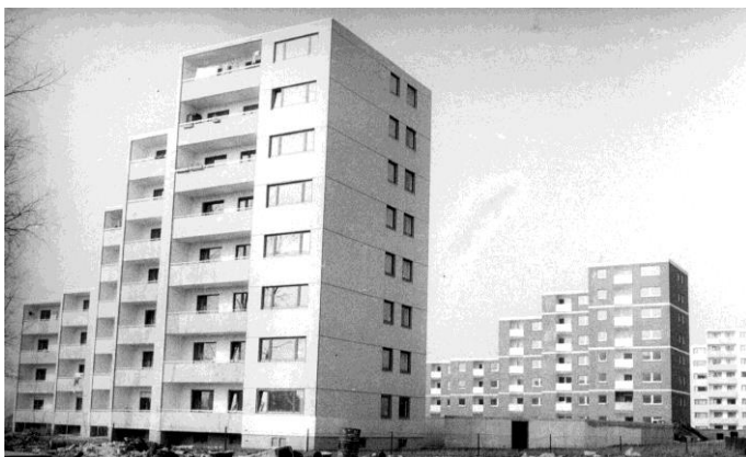
Eine Fotografie aus der Sammlung des Stadtarchivs mit den Hochhäusern der Helfgerd-Siedlung kurz nach ihrer Fertigstellung 1973. Die Gebäude sollten die Fortschrittlichkeit der jungen Großgemeinde Verl bezeugen.