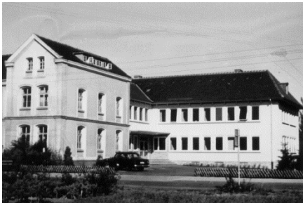
Die Fotografie aus dem Jahr 1959 zeigt links einen Teil des Altbaus des Amtshauses mit dem sich rechts anschließenden Neubau.