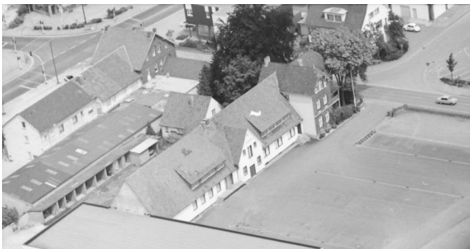
Die Villa und die Fabrikgebäude der Firma Johann Tausch auf einer Luftaufnahme aus dem Jahr 1975.