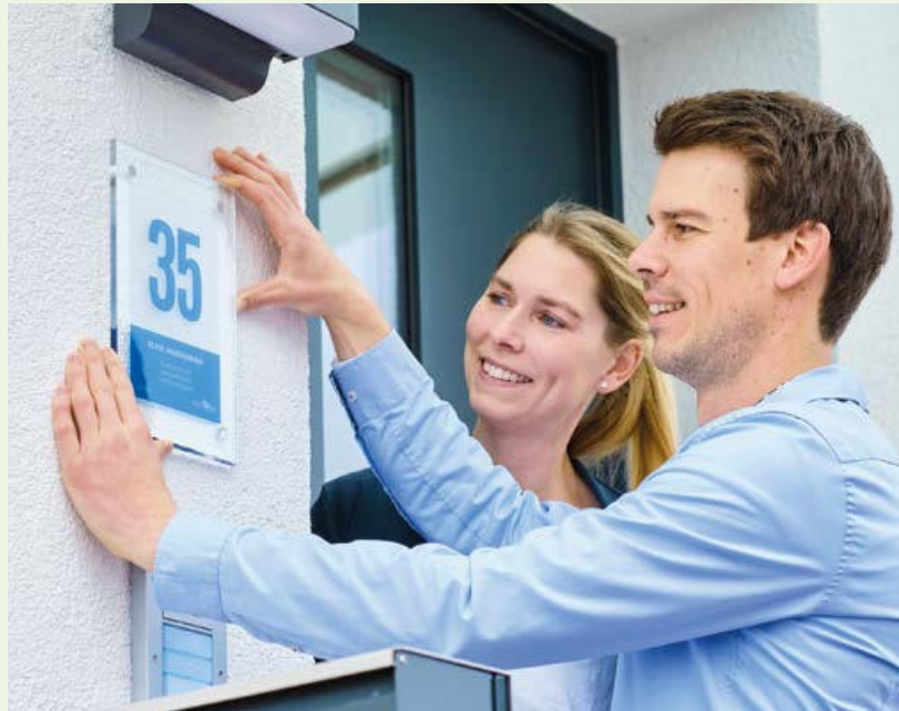
Dieses Haus wurde klimafreundlich errichtet. Die Bauherren freuen sich über die Auszeichnung: ihre eigene „Blaue Hausnummer“.

Sie haben Ihren Altbau nach dem 01.10.2009 energetisch auf Vordermann gebracht oder wirksame Einzelmaßnahmen durchgeführt? Sie haben in diesem Zeitraum einen klimafreundlichen Neubau fertiggestellt? Bewerben können Sie sich unter Klimaschutz/Stadt Verl. Bei Fragen können Sie sich gerne an das Klimaschutzmanagement der Stadt Verl wenden (siehe Kasten rechts). Wenn Sie die im Bewerbungsbogen genannten Auszeichnungskrite-