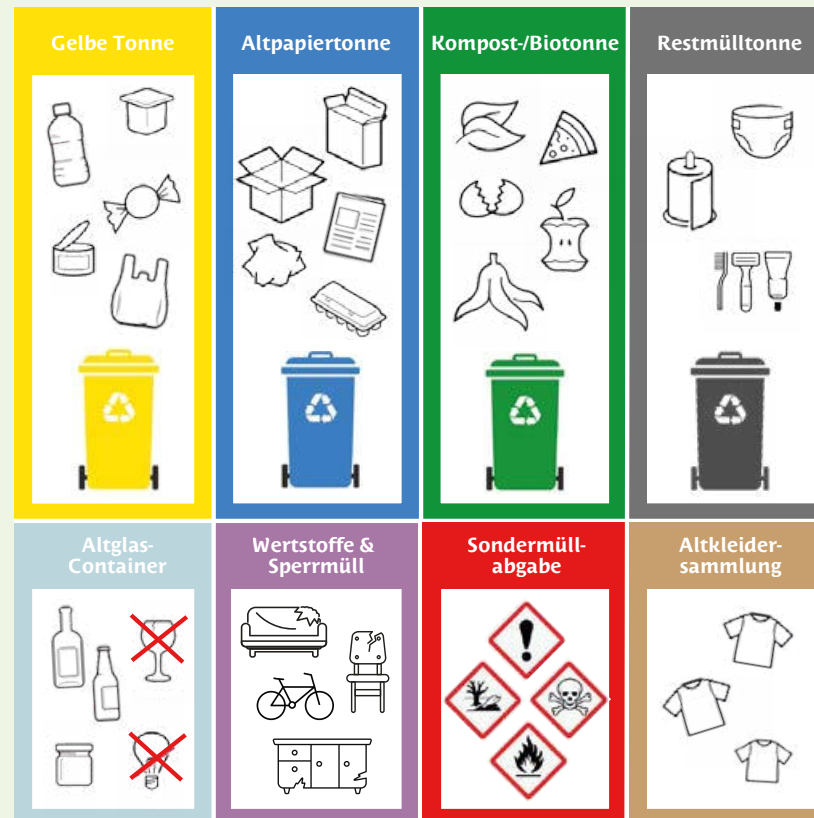
Grafik: Stadt Verl

Eine detaillierte Auflistung, welche Abfälle welcher Kategorie angehören und wie sie korrekt entsorgt werden, können Sie dem Abfallwegweiser auf der Homepage der Stadt Verl entnehmen: