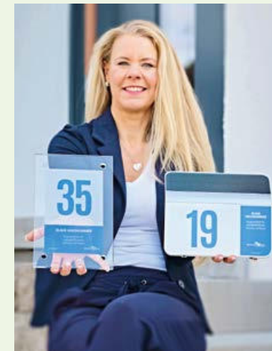
Die „Blaue Hausnummer“ gibt es als Glasschild oder als Solarleuchte.

der Blauen Hausnummer, die am Haus angebracht werden kann, besteht die Möglichkeit zwischen einem Glasschild oder einer Solarleuchte zu wählen.