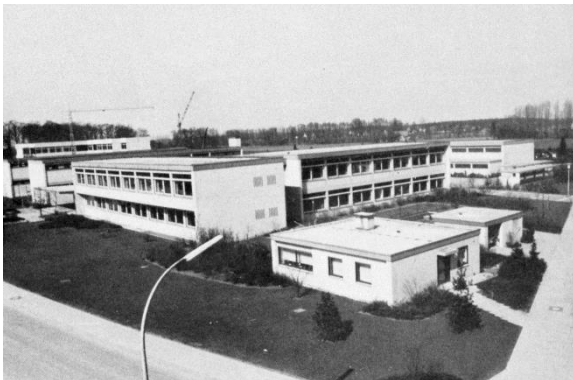
Auf der Fotografie aus dem „Adreßbuch der Gemeinde Verl 1971“ ist hinter der Realschule die Hauptschule zu erkennen, noch von Baukränen umgeben. Dort begann der „Schnatgang“.