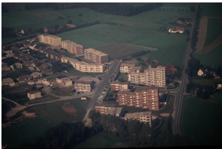
1971 war die Helfgerd-Siedlung mit ihren Hochhäusern noch im Entstehen begriffen. Das Luftbild zeigt sie im Jahr 1980 und stammt aus der Sammlung Friedrich Adämmers im Stadtarchiv.

Schließlich richteten die Journalisten ihren Blick noch nach Sürenheide, wo im Baugebiet Helfgerd in den kommenden Jahren Wohnraum für 1000 Menschen entstehen sollte. Die ersten Familien waren bereits eingezogen, während um sie herum weitere ein-, zwei- und dreigeschossige Gebäude, aber auch drei Hochhäuser entstanden.