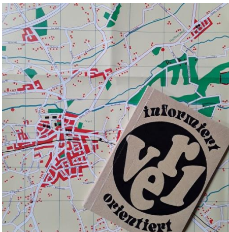
Diese „neue Informationsschrift mit fünffarbiger Karte der Großgemeinde“ erschien im Februar 1971 in Verl.