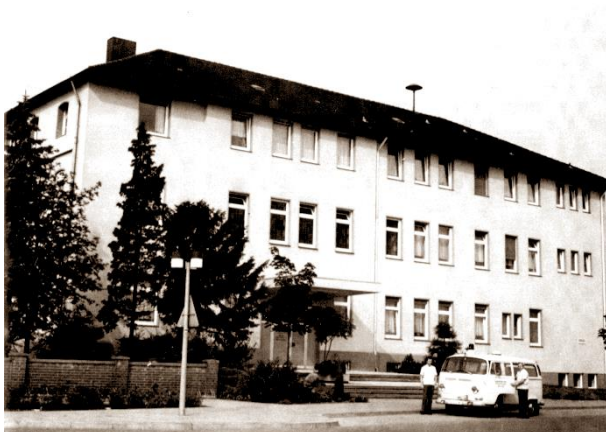
Die Fotografie aus dem Band „Verl, eine Gemeinde mit Zukunft“ (Gütersloh 1978) zeigt das modernisierte St.-Anna Hospital mit dem Krankenwagen der Gemeinde Verl, dessen Anschaffung der Haupt- und Finanzausschuss im Juni 1972 beschlossen hatte.

Weil die Baukosten binnen vier Jahren von den veranschlagten 1,5 Millionen auf 2,4 Millionen D-Mark angewachsen waren und die Eigenleistung der Kirchengemeinde auch zusammen mit den Zuschüssen des Bundes und der politischen Gemeinde Verl nicht ausreichte, sie zu decken, bat die Kirchengemeinde die Bevölkerung um weitere Spenden für das Hospital. Die Zeitungen veröffentlichten die entsprechende Kontonummer.